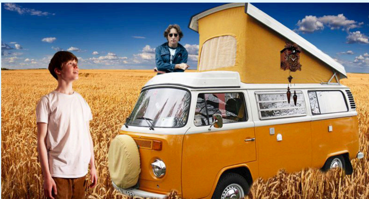
M:brane, Fjordic Film, Uncle Egg – Searching for a Dad .

informerade medborgare. Stöden syftar även till att främja konstnärlig frihet, interkulturell dialog och social inkludering.