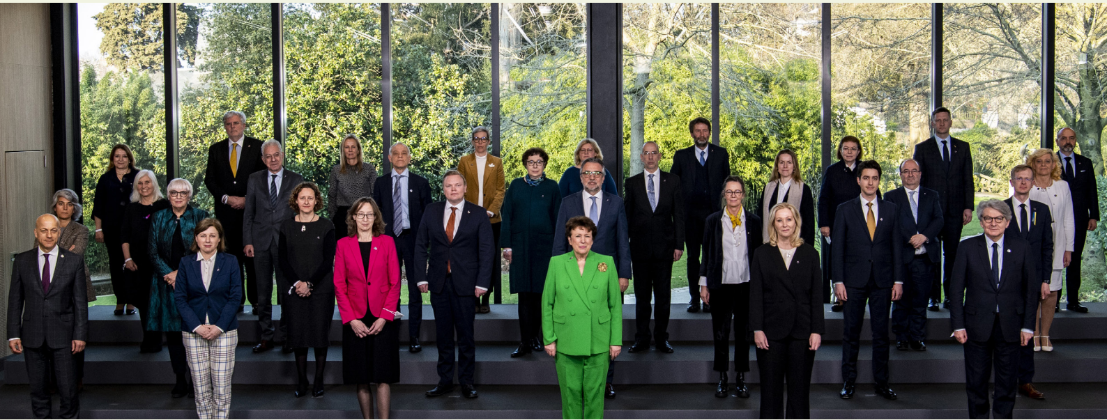
Bild från mötet med EU:s kulturministrar i Angers, Frankrike.