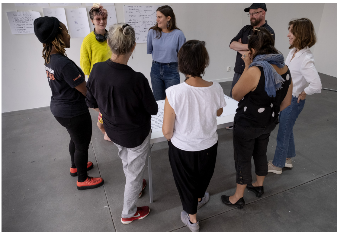
Artist-Run Network Europe: practice and theory på Konstfack, 2021.