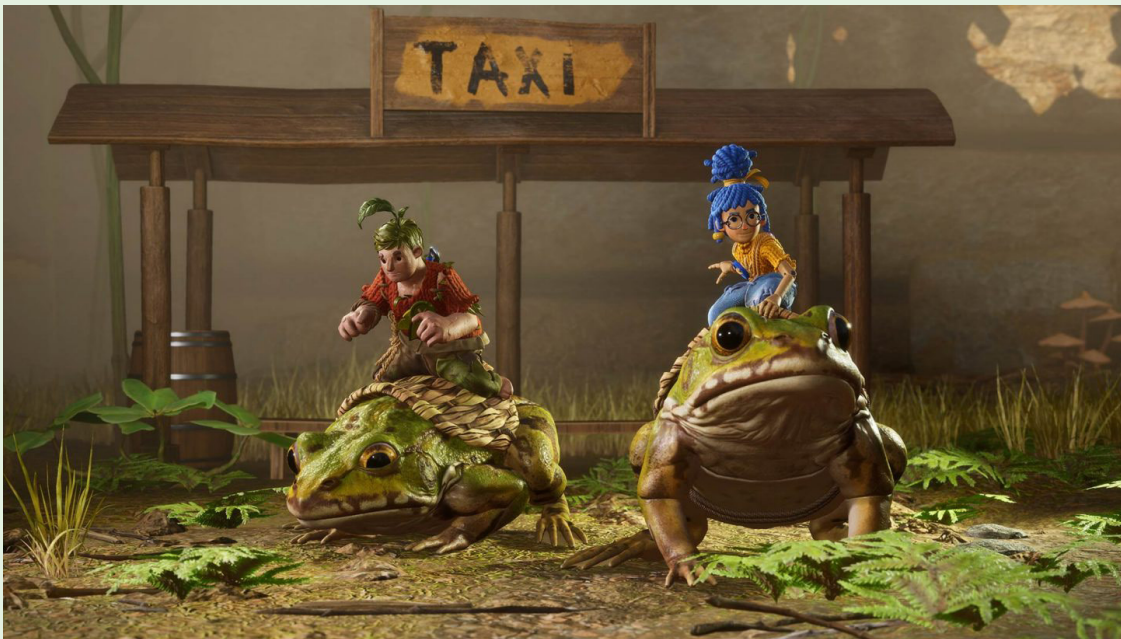
Dags att ta grodtaxin genom den förvildade trädgården.