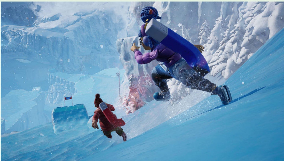
Cody och May rusar fram genom snön när de magiskt transporterats in i familjens snöglob.