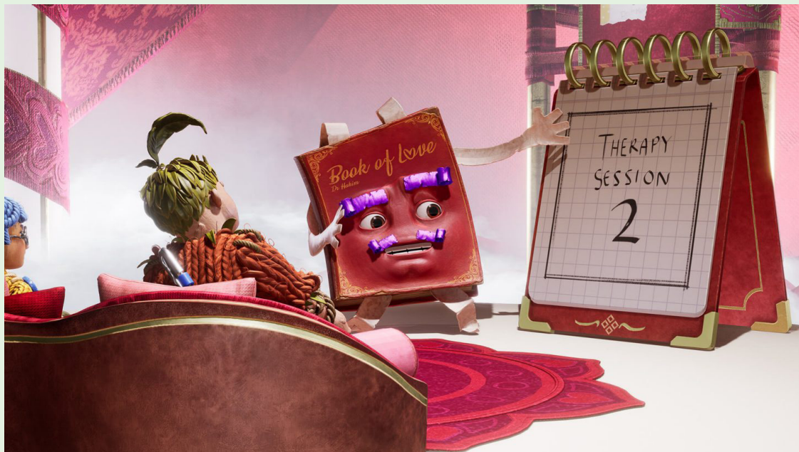
Kommer Dr. Hakim att lyckas? Kan Cody och May hitta tillbaka till varandra?

– Att bara få bli nominerad till det priset är en stor ära och prestation, säger Oskar och ler.