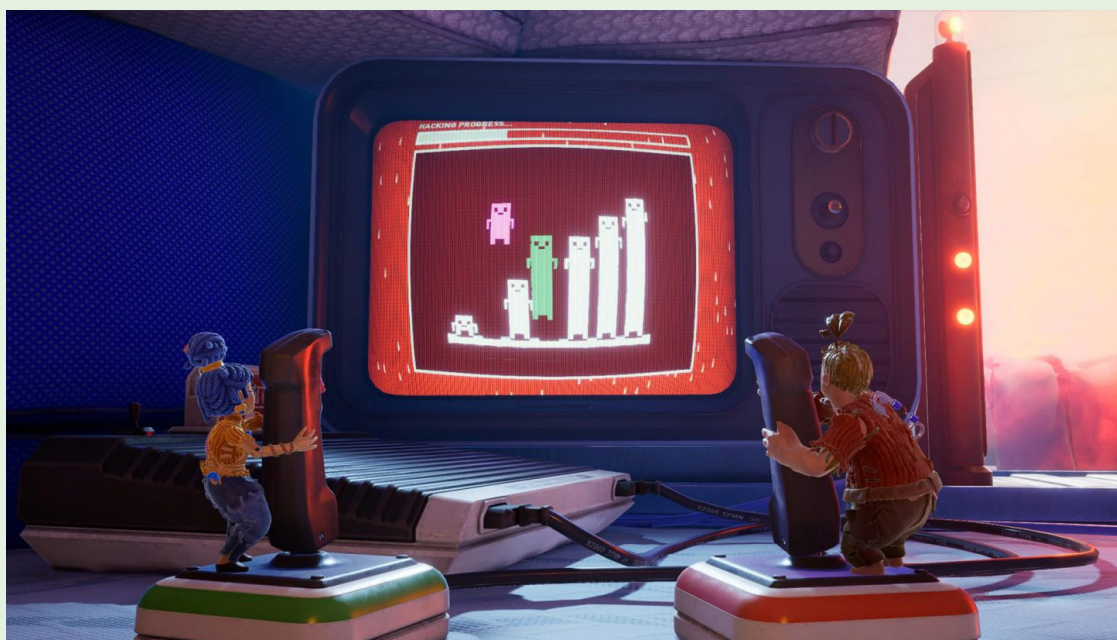
Det gäller att lista ut vad som ska göras och samarbeta.

– Så i samband med att vi växer har jag gått in mer i rollen som studiochef och jobbar med driften – att skapa en så bra kreativ miljö som möjligt runt alla så att folk kan fokusera på det de är bäst på. Jag stöttar också upp där det behövs, är med och spånar under kreativa möten och sköter PR och marknadsföring med EA i samband med släpp – bland annat. Men för mig i min roll är det oerhört viktigt att alla ska känna att de är en del av spelen vi gör – att alla anställda kan känna att det här spelet är mitt, jag har bidragit till att göra det. Att jag tagit på mig den här rollen innebär också att Josef kan fokusera på det kreativa i spelen till hundra procent, vilket är väldigt viktigt.