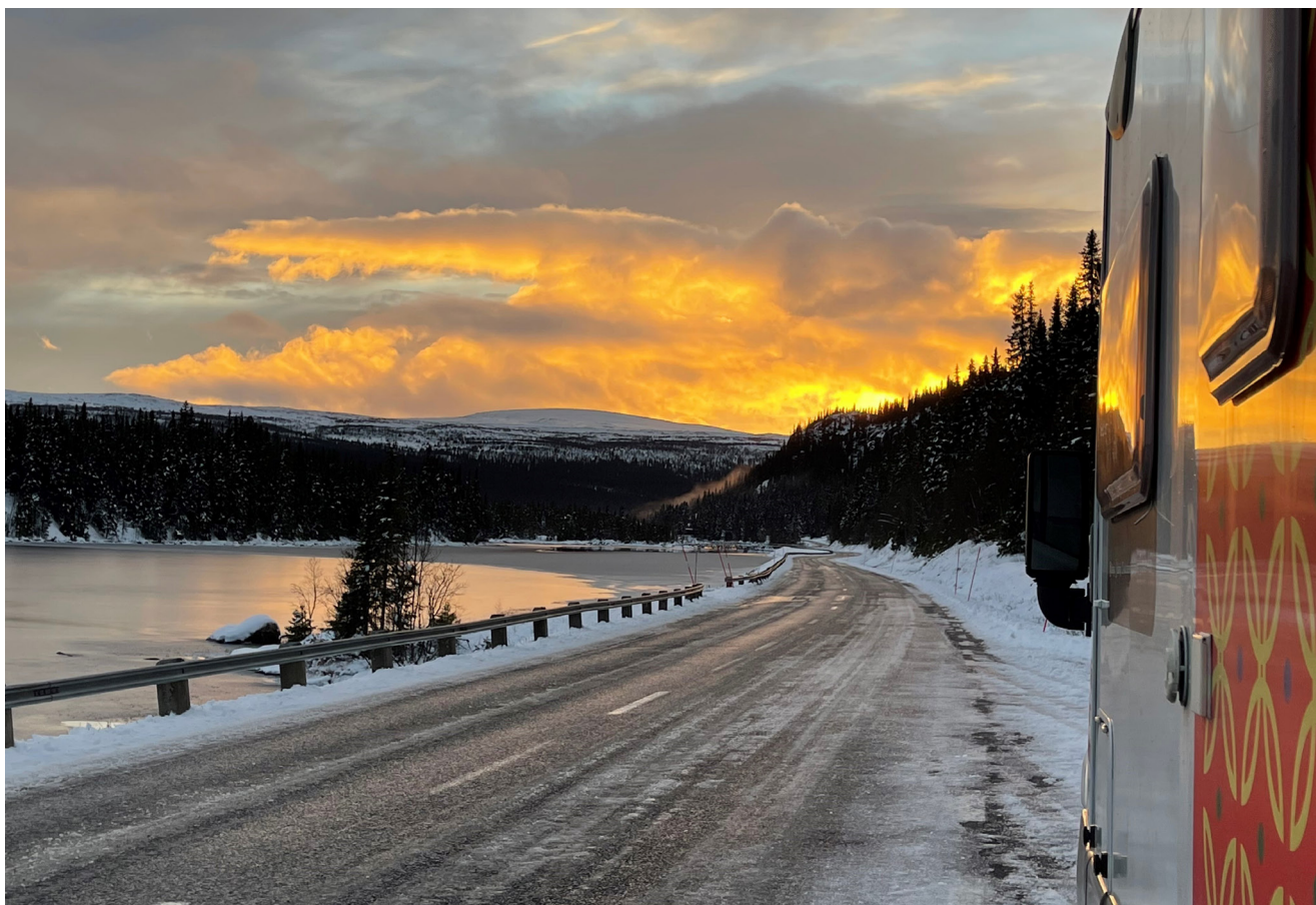
En västerbottnisk solnedgångsbild från när den samiska kulturbussen Julla Májja är ute och åker.