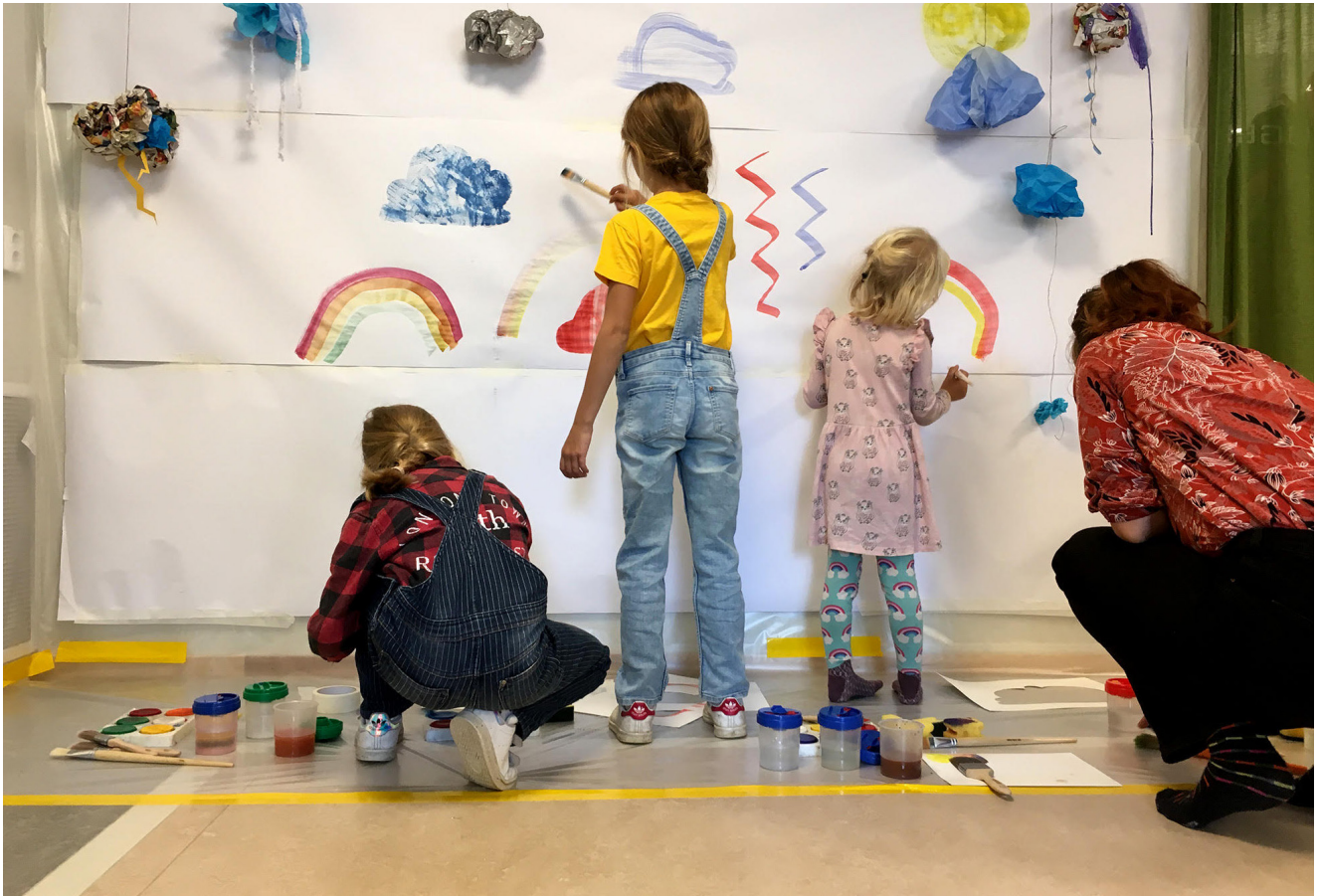
Skaparverkstad på Ljusdals bibliotek.

"Under pandemin blev behovet av digital utrustning och kompetens ännu tydligare. Plötsligt var det inte bara kommuninvånarna som behövde hjälp med det digitala utan även andra kommunala verksamheter."