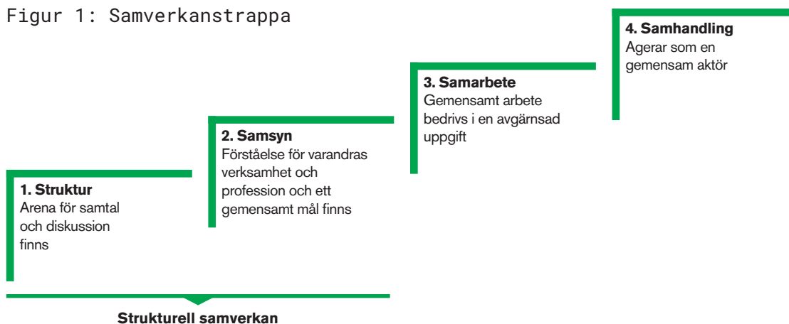
Figur 1: Samverkanstrappa