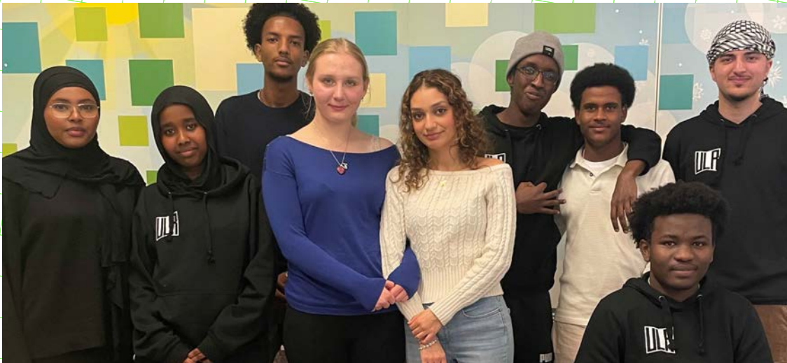
Sandvikens unga läsråd.