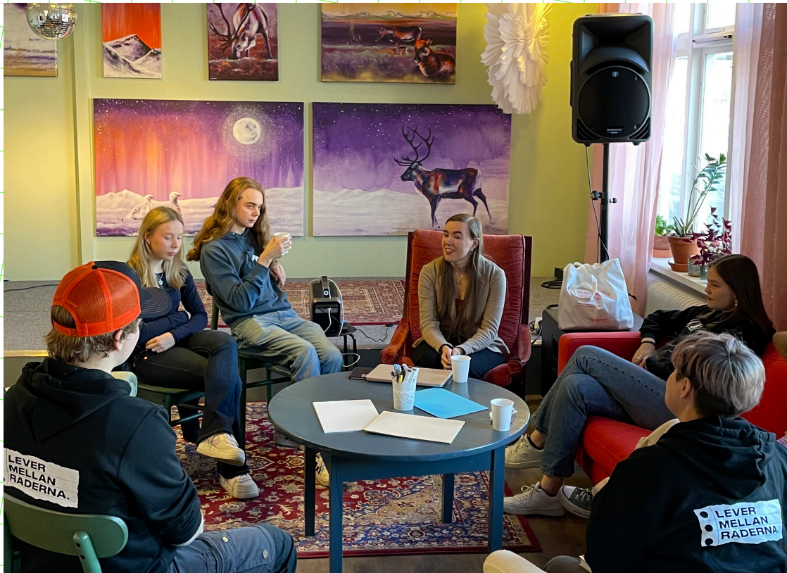
Berättarcirkel. I muntligt berättande är improvisation och kollaborativt berättande viktiga redskap.