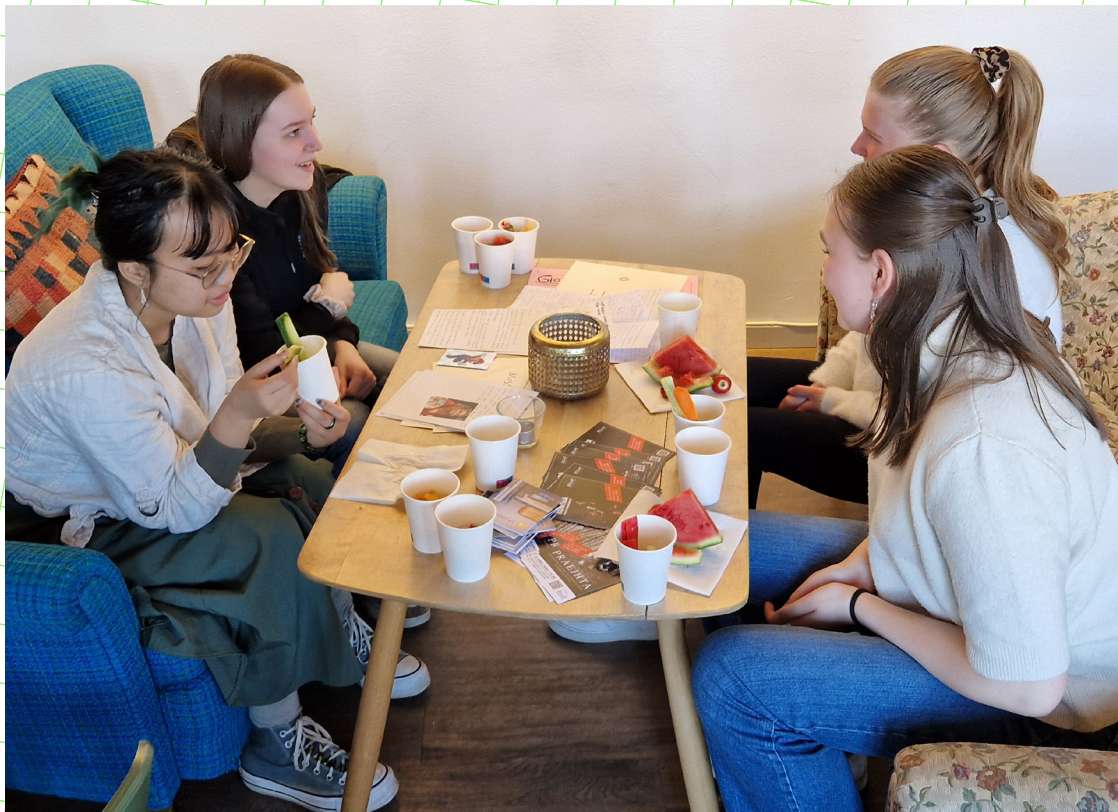
Energipåfyllnad. Skrivövningen varvas med fika och samtal.