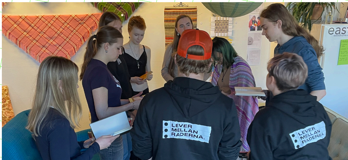
Det går att experimentera med röst, rytm och inlevelse under högläsning.