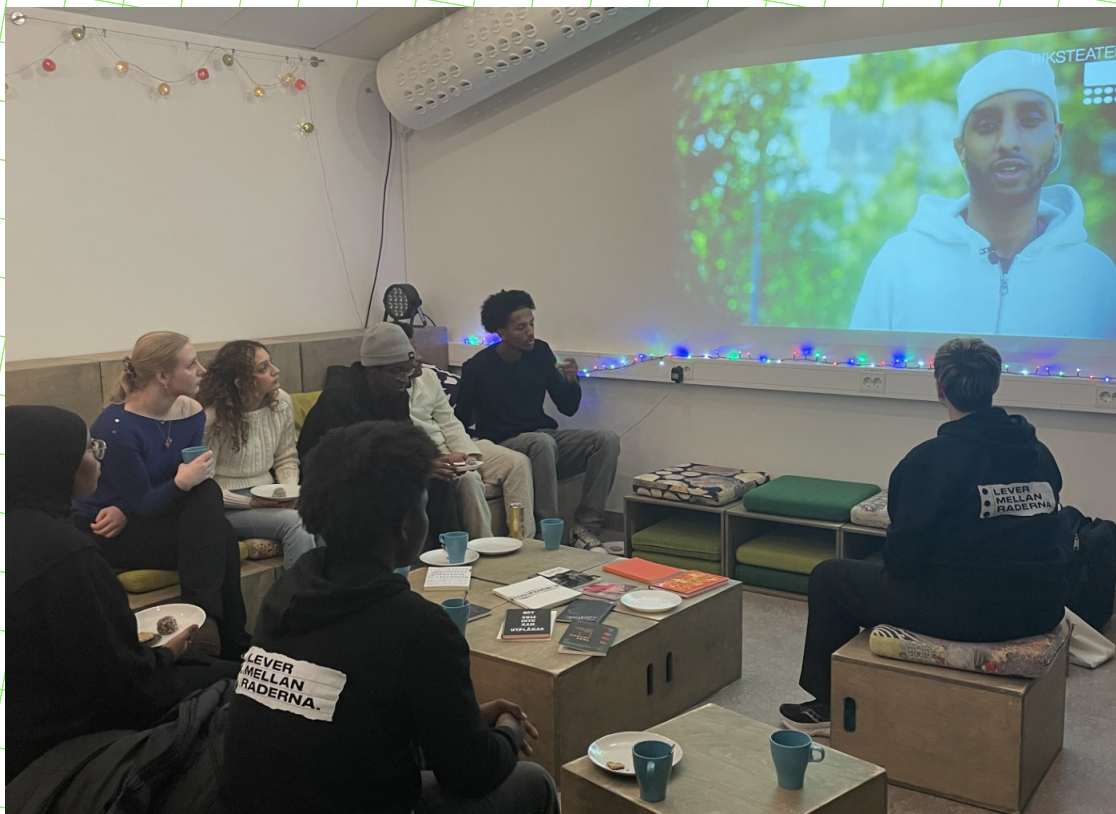
Att titta på diktvideor ihop är en väg in i skrivandet.