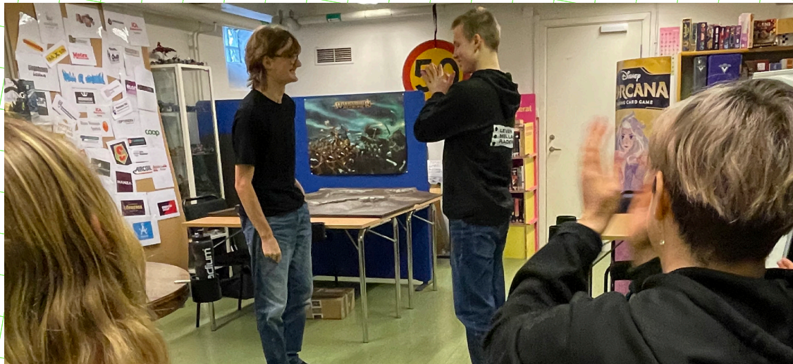
Det är viktigt att peppa varandra under gestaltningsövningar.