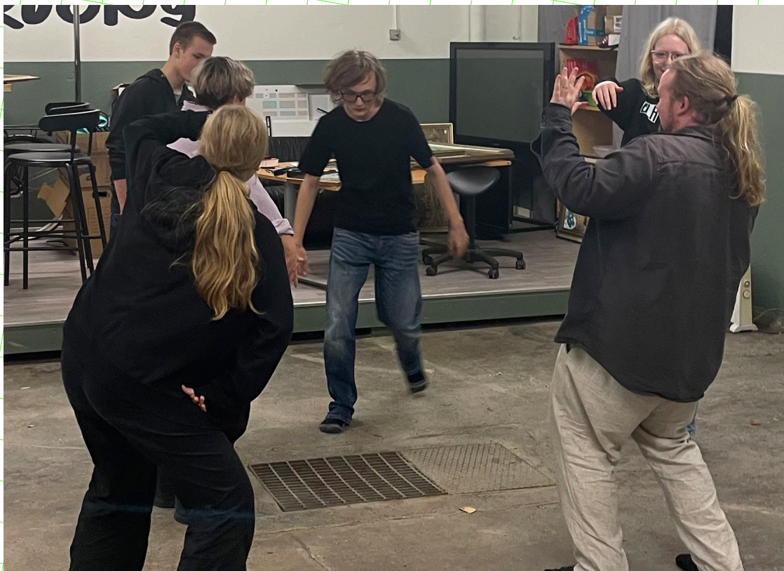
Att värma upp med teaterlekar är ett sätt att bygga gemenskap och trygghet.