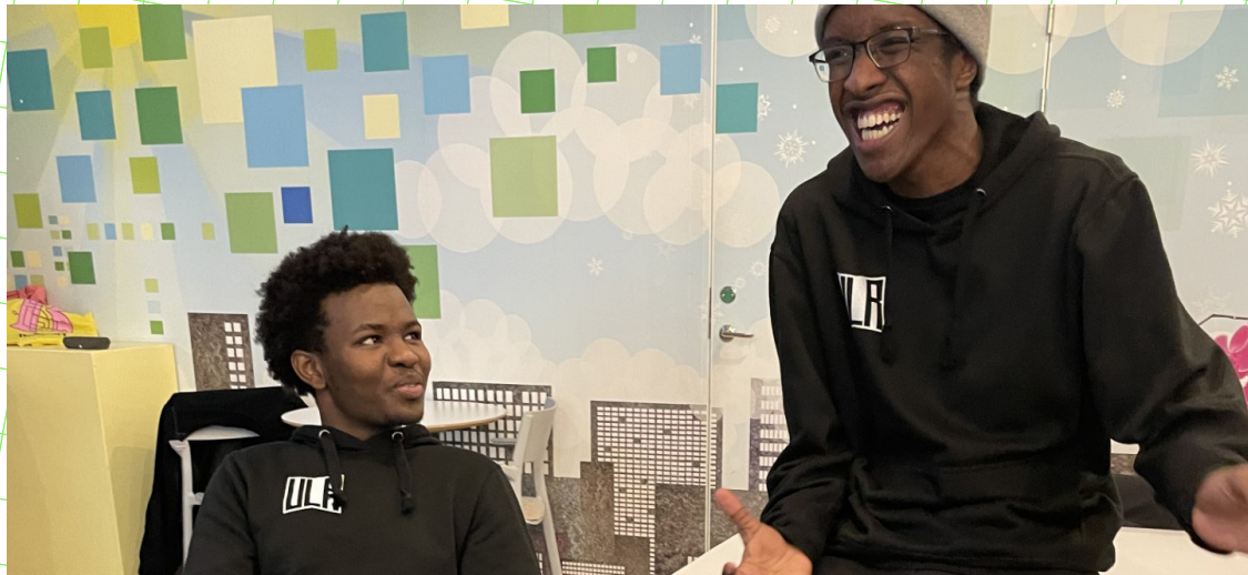
Improvisationsövningar leder ofta till både skratt och nya idéer.