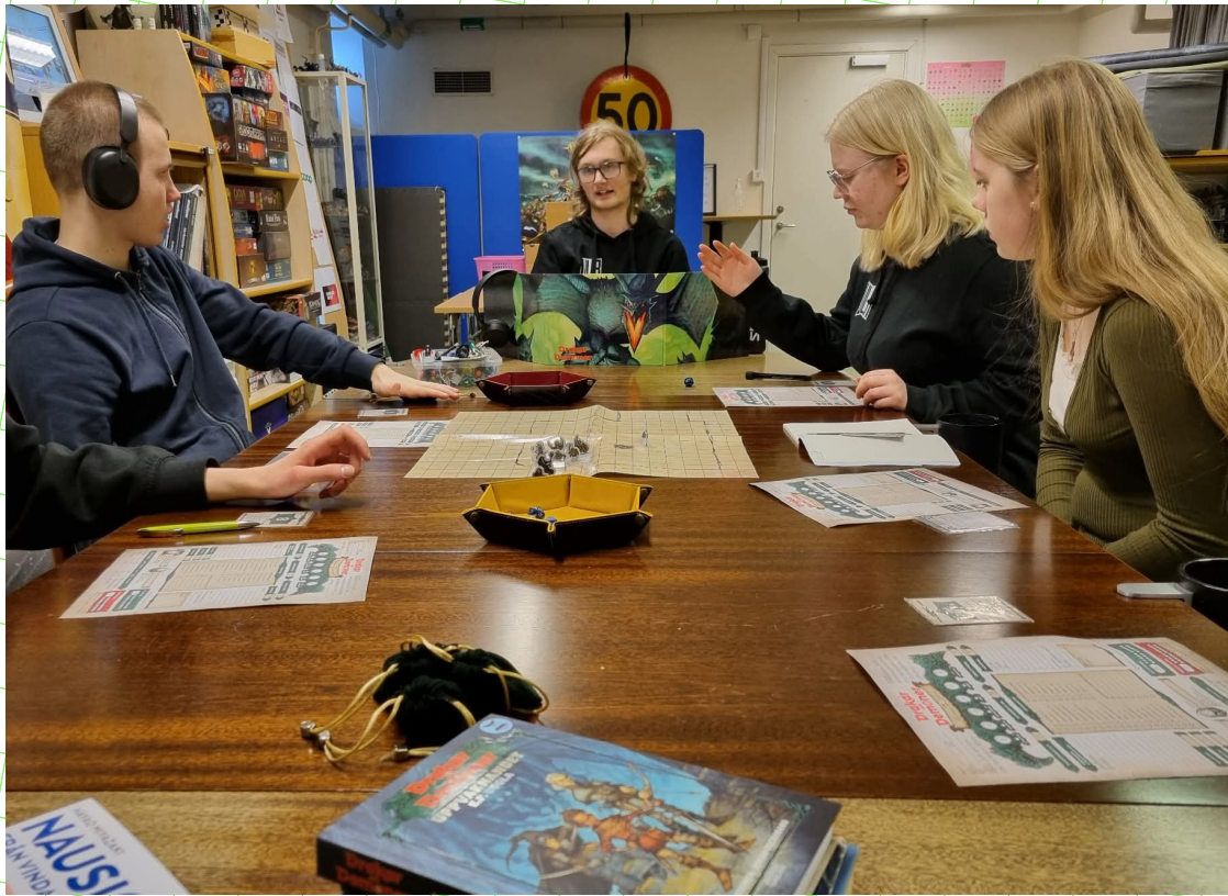
Att använda rollspel för att skapa en berättelse ihop skapar engagemang.