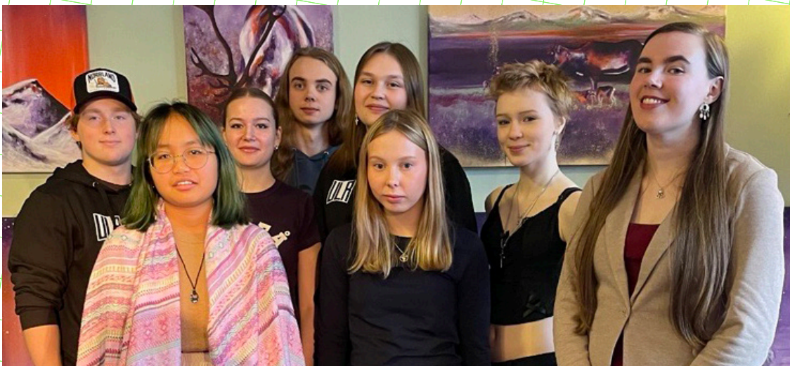
Jokkmokks unga läsråd.