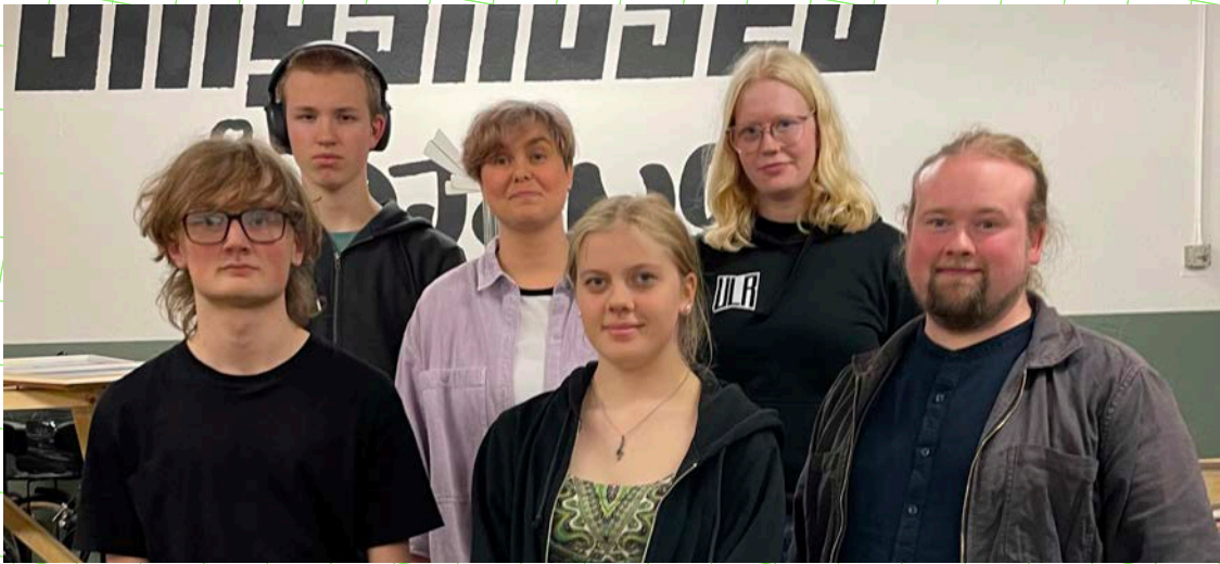
Ärjängs unga läsråd.